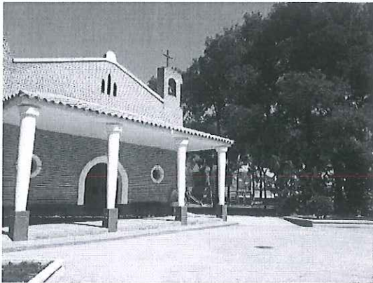
LA ERMITA CON EL PARQUE DETRÁS