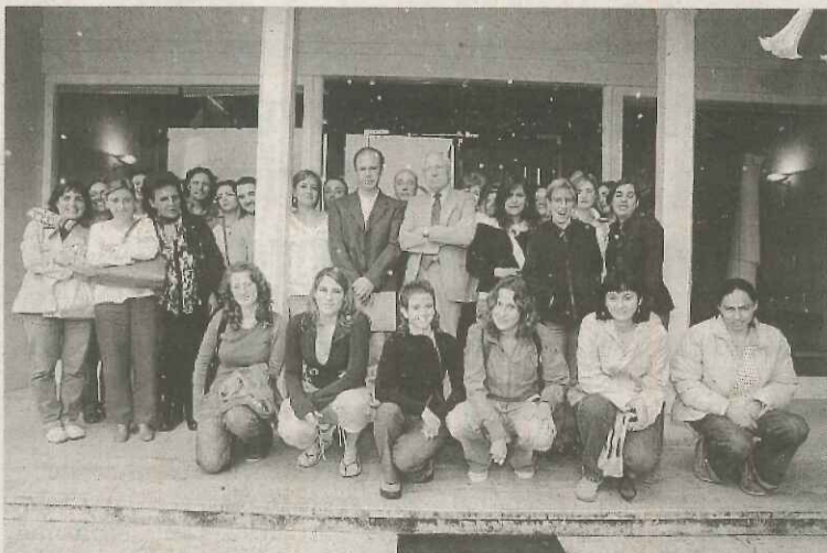
AL COMPLETO. Profesores y alumnos de la Escuela. / CELEDONIO

La presente edición se centra, por ejemplo, en la aplicación de la