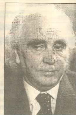
Antón García Abril , Medalla al Mérito Cultural para reconocer su aportación, como compositor, a las formas musicales contemporáneas.